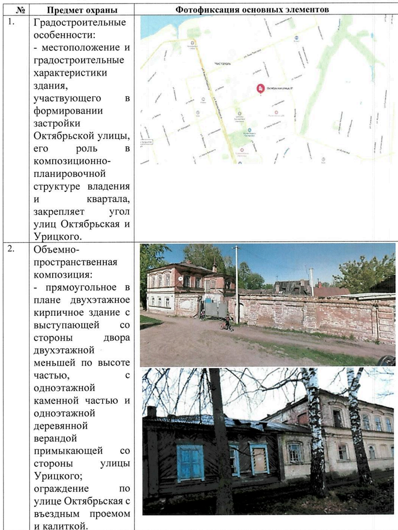
ТАБЛИЦА ПРЕДМЕТА ОХРАНЫ (ОСНОВНЫХ ЭЛЕМЕНТОВ, ПРЕДЛАГАЕМЫХ К ОХРАНЕ*)